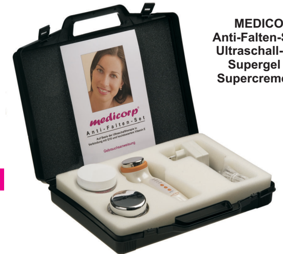
MEDICORP Anti-Falten-Set mit Ultraschall-Gerät, Supergel und Supercreme Plus

Anti-Age-Maske + Supergel + Supercreme PLUS + Ultraschall